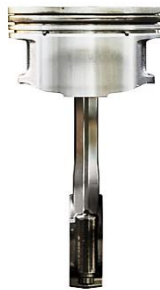
MAGMA SYN RNL 5W-30